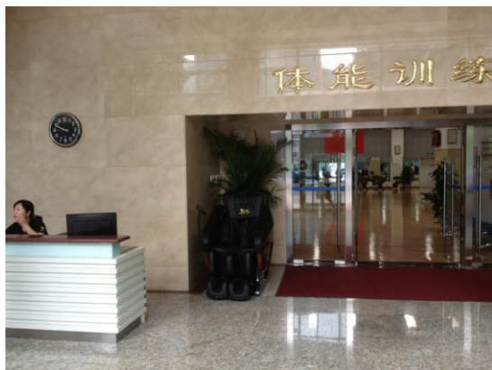
Entrée d'hôtel ??? ... Non, entrée salle de musculation !

Les volontaires sont des fans de badminton. Ils sont nombreux, facilement mobilisables et constituent, après sélection, l'essence des organisations. Ils n'ont aucune rétribution, aucun avantage mais la seule la joie de s'investir pour leur passion. Ils se regroupent de plus en plus pour organiser leur pratique. Les installations sont ici aussi un problème. Les investisseurs privés sont peu nombreux. L'état, les villes réhabilitent les anciennes usines pour les dédier aux pratiques sportives.