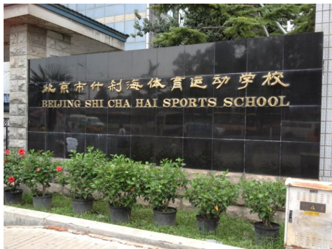
A chaque région son centre sportif

Le coach reconnaît la difficulté à recruter de bonnes joueuses filles car les parents ont de plus en plus de mal à reconnaître l'ascension sociale par le sport.