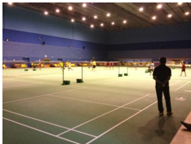
Deux halles comme celle-ci = centre régional

La chine cherche à s'ouvrir, à échanger. Nous pouvons bénéficier du centre. Nous y serons admis collectivement ou individuellement. Coachs et opposition nous serons proposés en fonction de notre niveau.