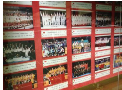
Sous l'œil des champions